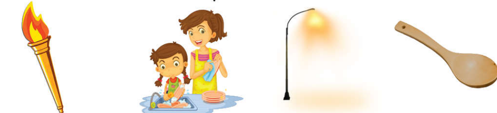
meşale bulaşık ışık kaşık

İsminde "ş" sesi başta mı ortada mı sonda mı?