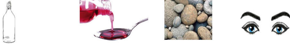
şişe şurup taş kaş

Aşağıdaki varlıkların isminde geçen "ş" harflerini işaretleyelim.